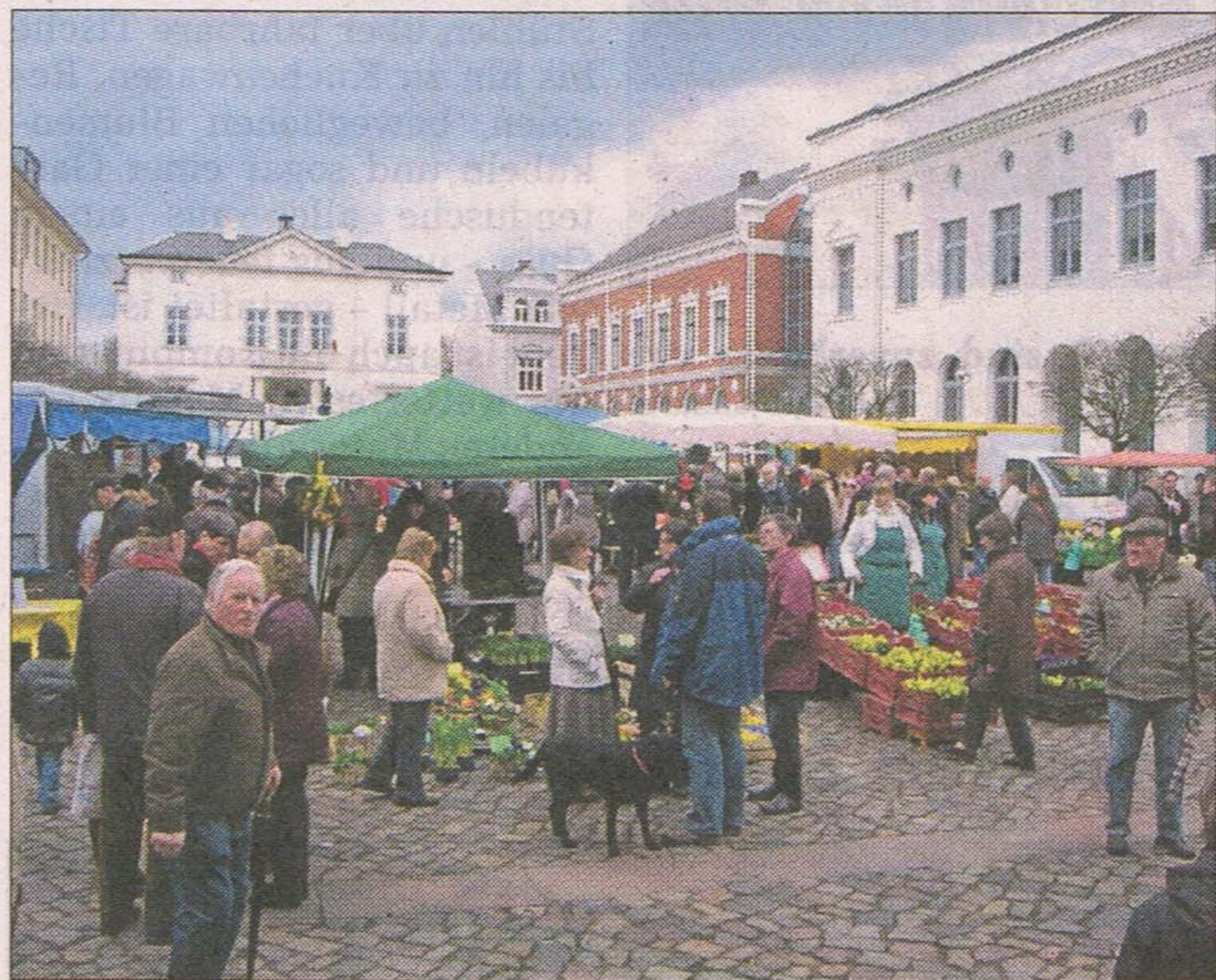
Großer Andrang herrschte an den Marktständen, die Frühlingsblumen anboten. Zwei Musiker aus Peru (oben rechts) verlockten ihr Publikum zum Tanzen.